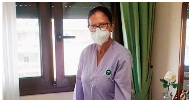
A prop: Mutuam a Casa