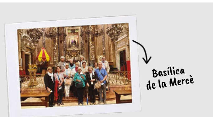
Basilica de la Mercè

Del barroc sacre als murals i grafitis, aquests mesos hem gaudit de l'art en totes les seves formes i facetes! A Penelles, Lleida, vam poder visitar un museu a l'aire lliure, ja que tot el poble està cobert de magnífiques obres murals; mentre que a la basílica de la Mercè vam descobrir els secrets d'un dels indrets més emblemàtics de Barcelona.