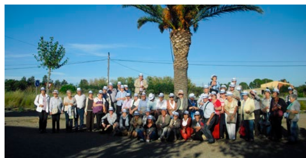
Activa't: reprenem les sortides